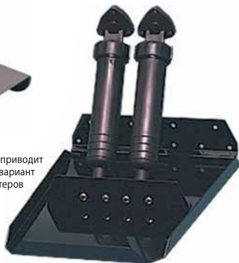
Рис. 3. Одну плиту приводит пара актуаторов – вариант для скоростных катеров